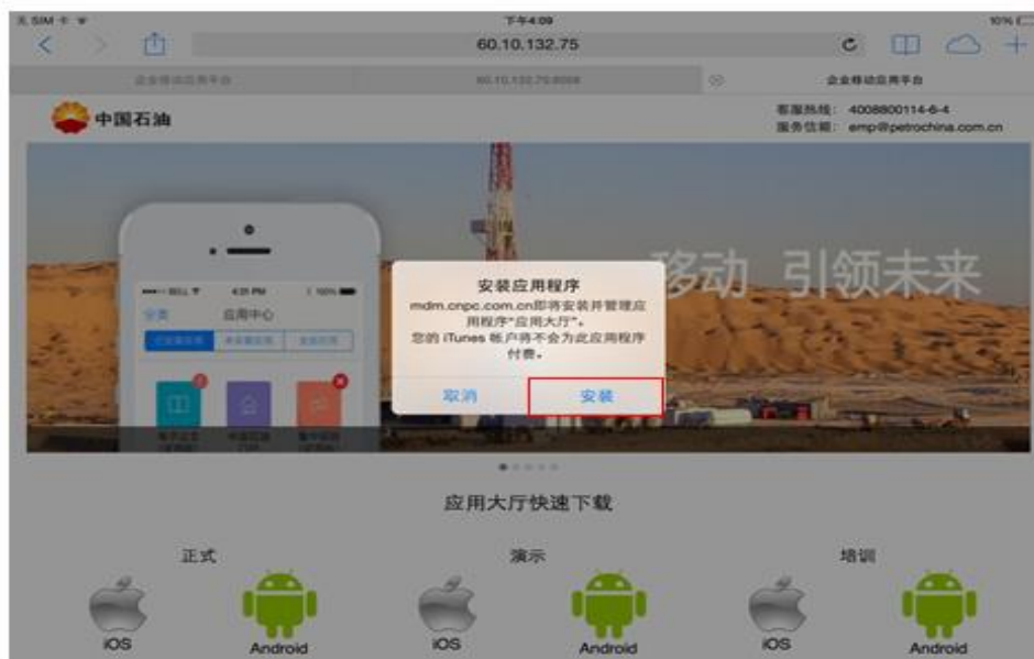
应用大厅推送至设备