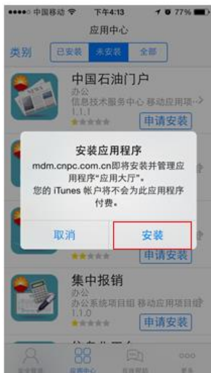
iPhone 应用大厅更新提示