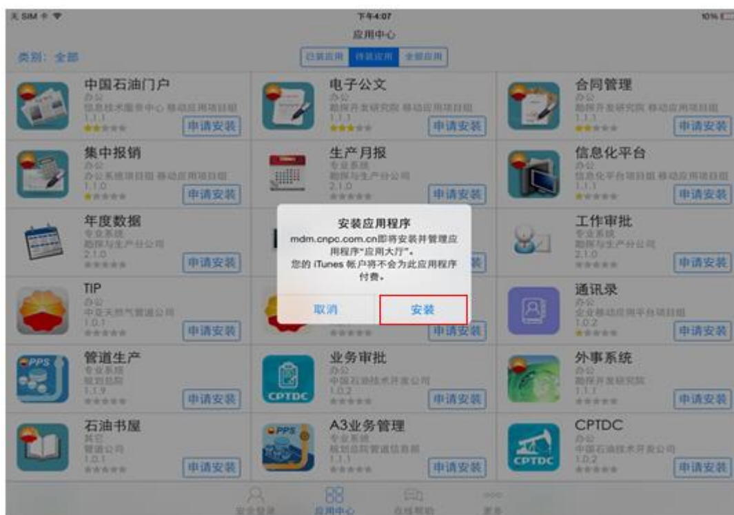
iPad 应用大厅更新提示

(1) 用户登录老版本应用大厅，会弹出新版应用大厅安装提醒，点击安装即可。如果设备没有升级 iOS8,老版本应用大厅仍可继续使用。