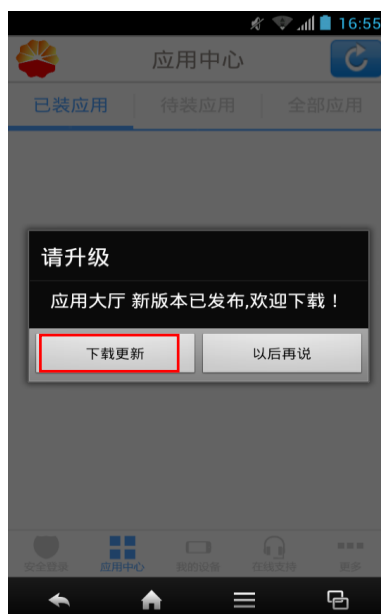
安卓应用大厅更新

1、版本更新：新版本应用大厅发布后，移动终端登录大厅后，会弹出更新提醒，直接下载更新安装即可。