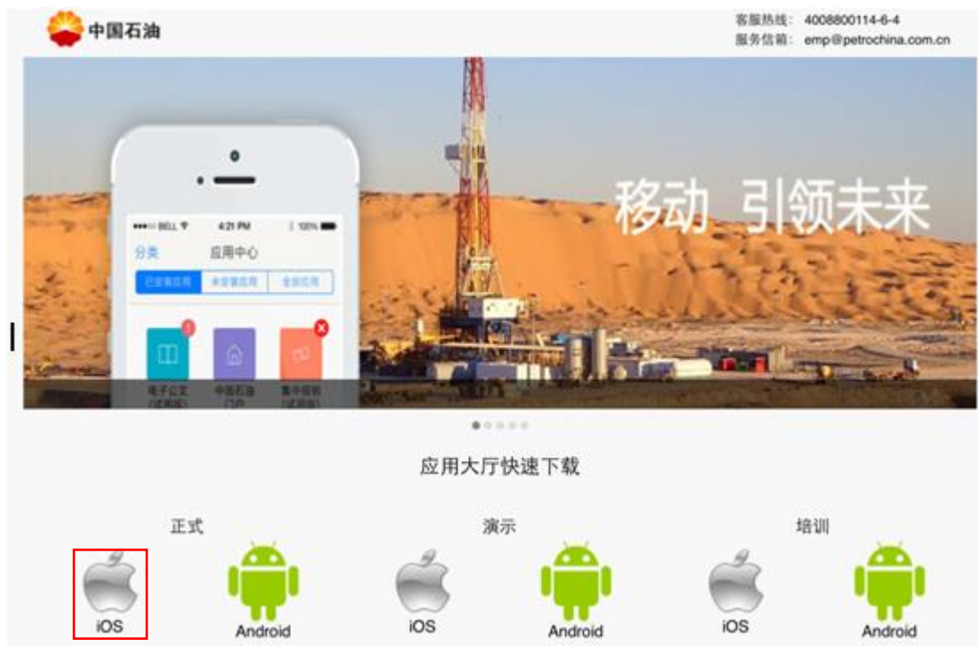
应用大厅下载页面

顺序接受弹出的提示对话框完成证书安装，根据网络状况不同等待数秒至数分钟后，平台推送应用大厅到设备桌面，点击安装即可。如果期间要求输入密码，请输入设备的开机密码。